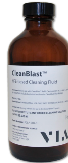
FCLP-SOL1 7.61 oz / 225ml